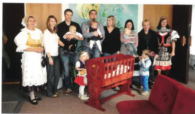
Vítání občánků 15. 10. 2016