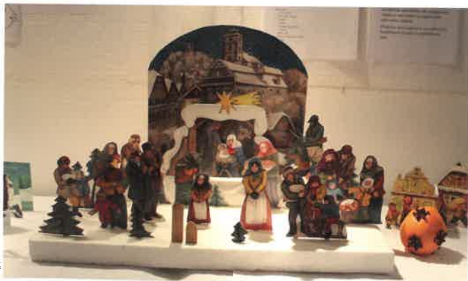
Sobotecký betlém - vánoční výstava v Muzeu F. Šrámka