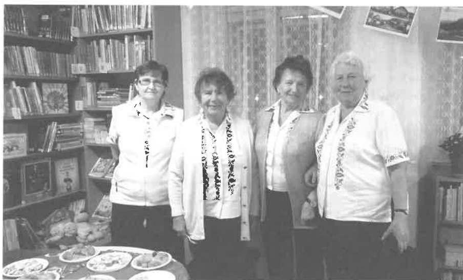
Ochutnávku vánočního pečiva připravily tetičky baráčnice.