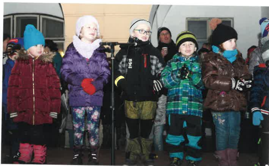
Koledy při rozsvěcení vánočního stromu zazpívaly děti MŠ Sobotka – třída Krtečků, pod vedením Š. Kubištové a J. Bártové – foto: H. Reslová