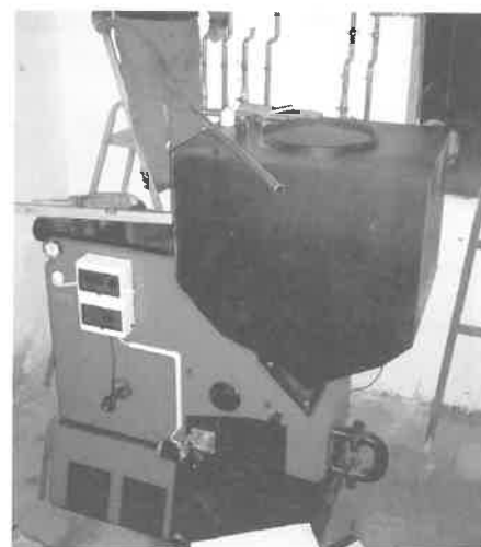
Nový automatický kotel